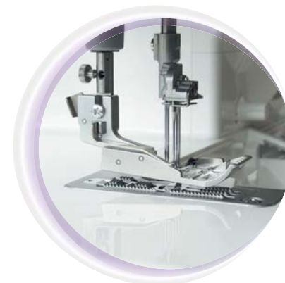
Extra grote voetlichting van 6 mm