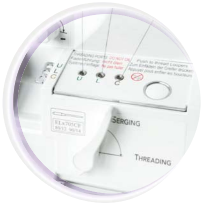
RevolutionAir™ Threading System met automatisch inrijgende grijpers