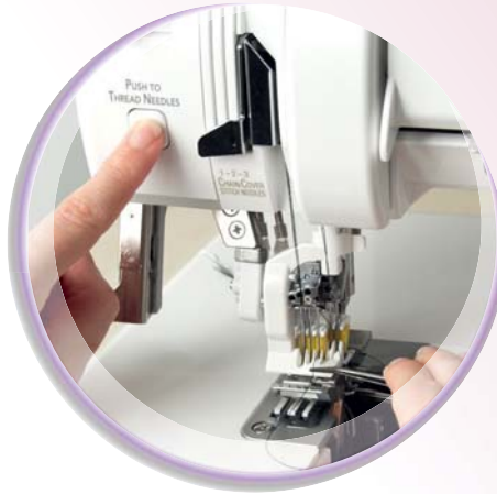
RevolutionAir™ Threading System voor het eerst een coverlock met automatisch inrijgen

Optimaal naairesultaat met allerlei stoffen