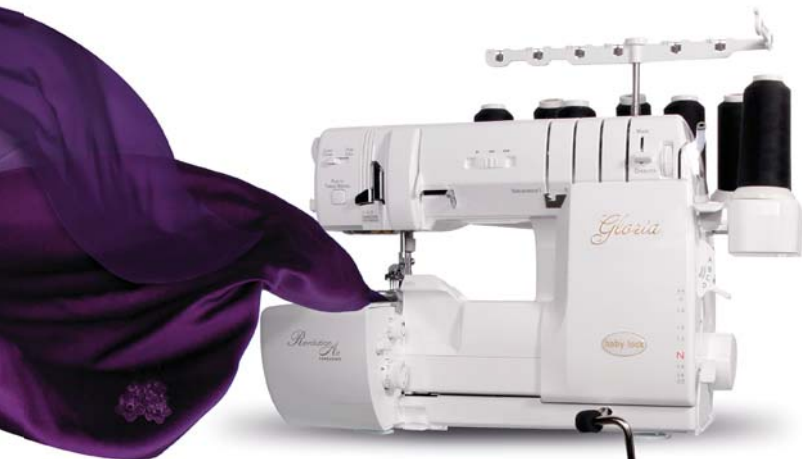
Geactrooieerd baby lock ATD-System

Optimaal naairesultaat met allerlei stoffen