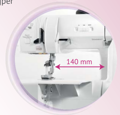
Snelheidsregeling en bijzonder brede doorlaat