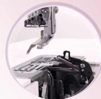
Stevige grijperkanalen met inklapbare hulpgrijper